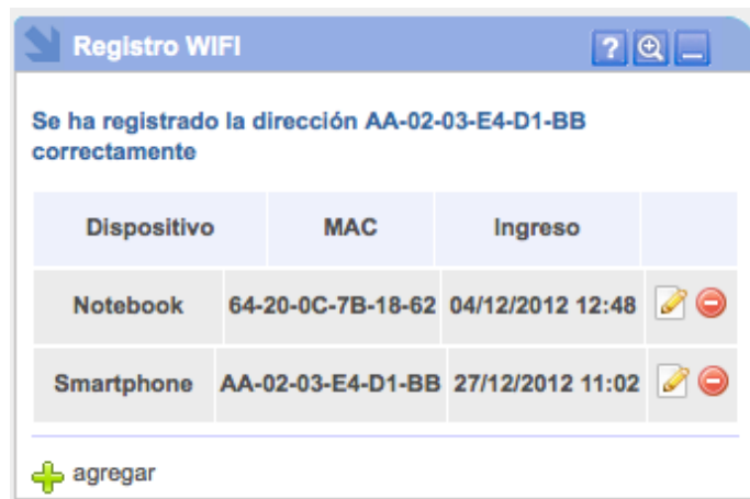
Figura 2. Registros WIFI.